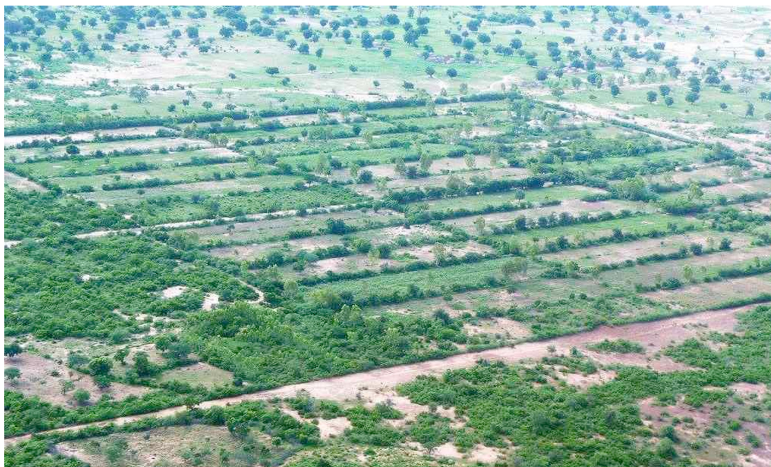
Fig. 6. Vue aérienne d'un site bocager (Guiè, 2016).

La viabilité technique et environnementale de l'ensemble repose donc sur ces fermes pilotes. Le choix des rotations et le conseil agroécologique (choix des variétés, lutte intégrée, production de semences) sont fournis par la ferme pilote qui joue un rôle comparable au service de développement rural délivré par les chambres d'agriculture en France. Le premier souci est ici d'éviter la dégradation du sol et au contraire l'améliorer. Dans ce but, les fermes pilotes améliorent la fiabilité des conseils par des champs expérimentaux et essais comparatifs d'espèces et production de plants. Chaque ferme possède une pépinière, des équipes d'encadrement, de formation à l'équipement agricole et d'aménagement foncier. L'élevage tient un rôle important par l'apport de fertilisation des sols. Mais les éleveurs ne sont pas cultivateurs et réciproquement, situation à l'origine de conflits ancestraux qu'il convient de surmonter par des accords locaux.