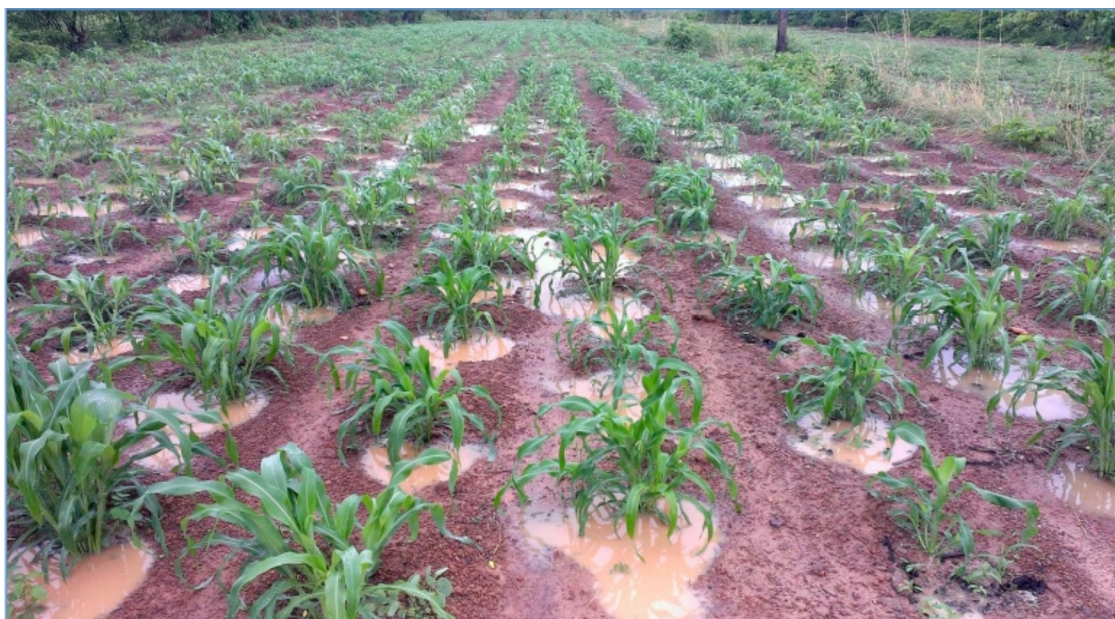
Fig. 2. Culture en zai (Guiè, 2018).

géographique. Ce concept est totalement différent de celui du zai qui vise à freiner l'eau. C'est toutefois le rapprochement des deux modes d'action qui a été progressivement mis en pratique et théorisé (Baudin et Girard, 2017) dans les années 1990 par Henri Girard fondateur de l'ONG Terre-Verte à Ouagadougou ( www.eauterreverdure.org ). L'idée fondatrice est de retenir la pluie au plus près de l'endroit où elle tombe par un ensemble d'obstacles à différentes échelles, ceci en s'inspirant des bocages de haies et talus que l'on trouve en Europe occidentale et dans certaines traditions africaines au Togo ou au Cameroun.