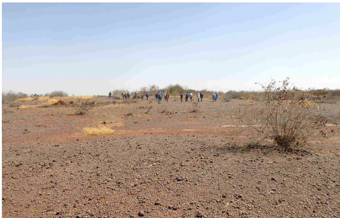
Fig. 1. Espace dégradé après disparition de la forêt (Kamsé, 2018).

La désertification est en outre accélérée par le prélèvement des arbres pour la cuisson des aliments, afin de répondre aux besoins d'une population en accroissement rapide. Le bois, en effet, est la seule énergie accessible aux paysans du Burkina Faso. Ici, la crise énergétique est la pénurie de bois à brûler. Ce déboisement fait disparaître les niveaux supérieurs de végétation qui jouent le rôle de protection des plantes et du sol. Il ne reste plus alors que des buissons résistant à la sécheresse, eux-mêmes prélevés par les animaux itinérants. En deux générations, une savane arborée vivante donne place à un espace de cailloux latéritiques sur une terre ocre devenue quasi imperméable (Fig. 1).