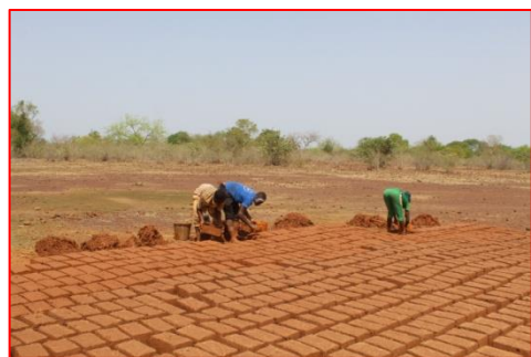
Confection des briques en banco

Les travaux de constructions se poursuivent avec la confection des briques puis la construction du 5 ème logement visiteurs (5m/5m).