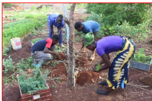
Reboisement du pourtour de la pépinière

Par ailleurs des activités de reboisement ont été réalisées autour de la clôture de la pépinière de la ferme. il s'agit des espèces végétales endogènes telles que casia seberiana (Kombresaka), l'acacia nilotica etc.