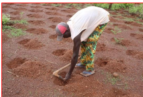
Semis du maïs