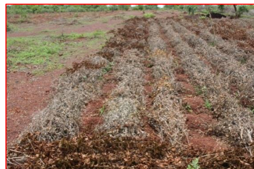
Champ d'essai paillé