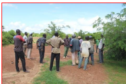
Visite de terrain pour un futur aménagement bocager

Les activités de construction se sont essentiellement focalisées sur le crépissage des maisons visiteurs. Crépissage des murs intérieurs d'une maison visiteur