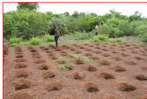
Poquets de zaï remplis avec du compost