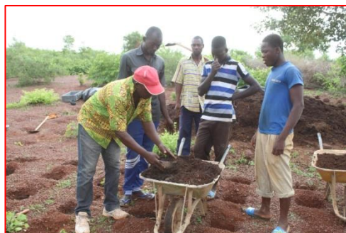
Mise du compost dans les poquets de zaï

Pour ce qui sont des activités agricoles, elles ont concerné le remplissage des poquets du zaï avec le compost, les semis du maïs et le paillage du champ d'essai du concept « nourrir ta famille ».