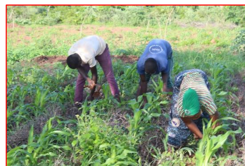
Deuxième sarclage du champ d'essai

Une visite d'évaluation à mi-parcours, suivie d'une rencontre de cadrage sur les techniques culturales du concept a été effectuée par le responsable de la promotion du Bocage sahélien de l'ONG TERRE VERTE.