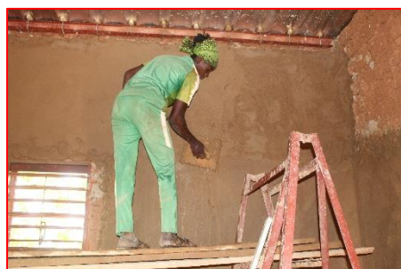
Crépissage des murs internes des logements visiteurs