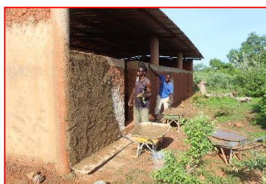
Crépissage des murs du hangar