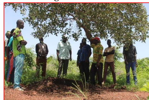
Réunion de cadrage sur les techniques culturales

Pour favoriser la bonne croissance des plantes, la fabrication d'engrais liquide de type biologique fût recommandée. Des moments de formation ont été déterminés pour cela à l'intention de tout le personnel de la ferme pilote bocagère.