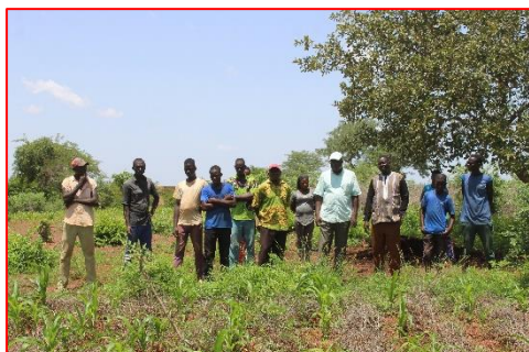
Visite d'évaluation à mi-parcours sur le concept nourrir ta famille

Une visite d'évaluation à mi-parcours, suivie d'une rencontre de cadrage sur les techniques culturales du concept a été effectuée par le responsable de la promotion du Bocage sahélien de l'ONG TERRE VERTE.