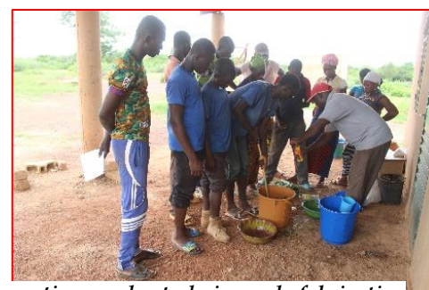
Formation sur les techniques de fabrication d'engrais liquide biologique

Pour ce qui est des activités de construction des bâtiments de la ferme, nous avons pu réaliser le crépissage des murs internes des 4 logements visiteurs ainsi que les murs internes et externes du hangar.