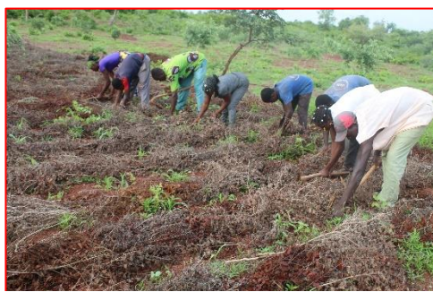
Premier sarclage localisé du champ d'essai