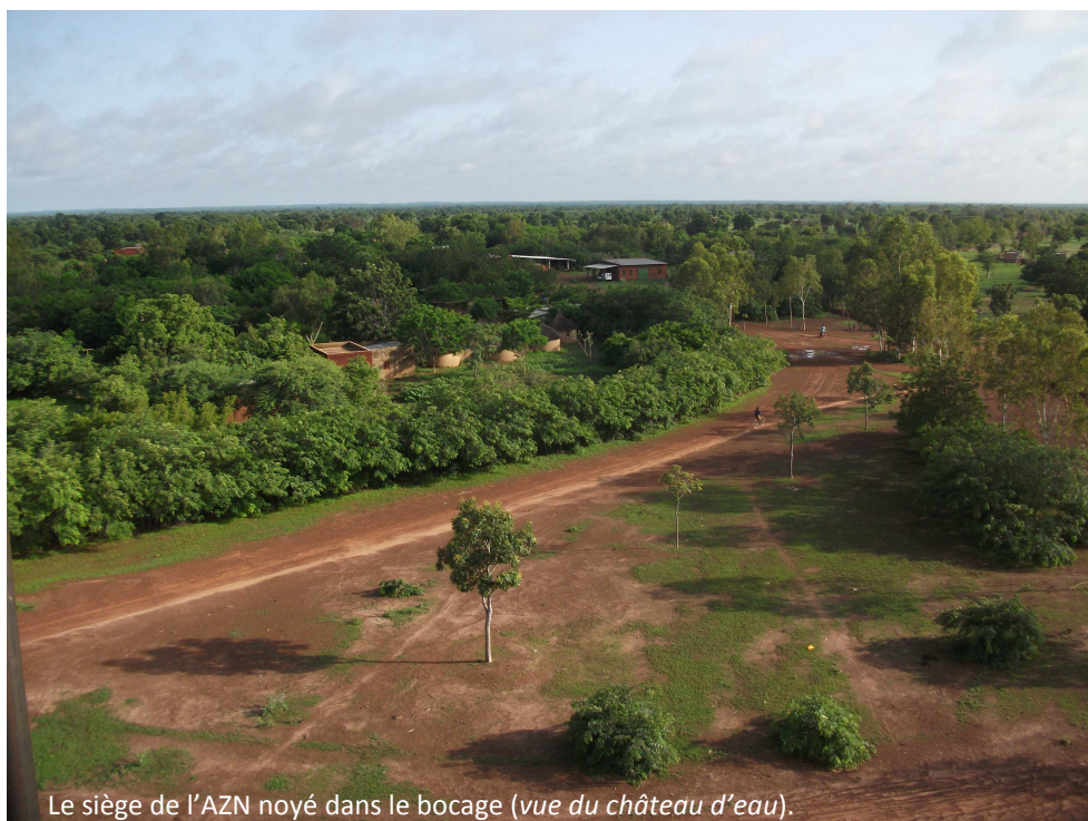
Le siège de l'AZN noyé dans le bocage (vue du château d'eau).