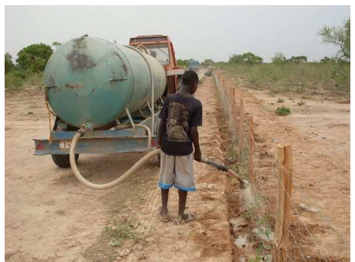
Plantation et arrosage de la haie mixte.