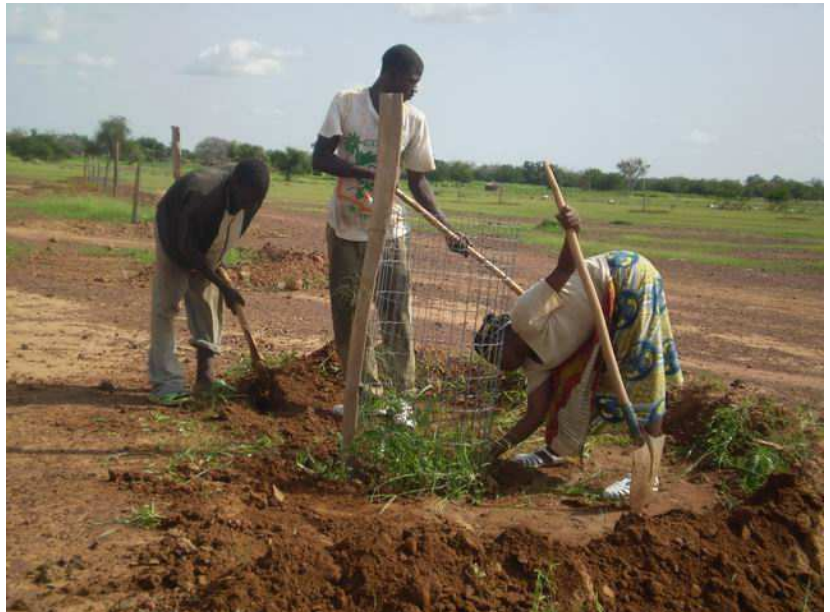
Construction de demi-lunes pour approvisionner les arbres en eau.

En Août, nous avons procédé aux travaux d'entretien des arbres. Au pied de chaque arbre nous étudions l'écoulement de l'eau et construisons une diguette en demi-cercle que nous appelons demi-lune, pour retenir l'eau afin d'assurer le bon développement de l'arbre.