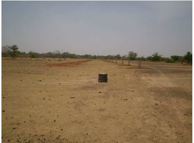
Aperçu de la route F.P.F

Pour y parvenir, nous avons entrepris l'aménagement de 4 routes principales de Filly, à partir d'un carrefour situé près de la ferme. Ces routes sont ainsi dénommées : route de Kourbo, route de Ziga, route de Bilinga et la route qui conduit directement à la ferme Pilote de Filly.