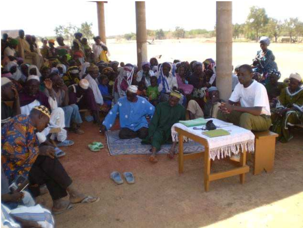
Association Filly Wémanegré/ Ferme Pilote de Filly AG du 31 janvier 2009 : Bilan annuel

Nous adressons nos sincères remerciements à nos partenaires qui n'ont ménagé aucun effort pour nous soutenir à réaliser cette campagne 2008 et nous accompagner dans notre quête quotidienne d'un avenir d'espérance.