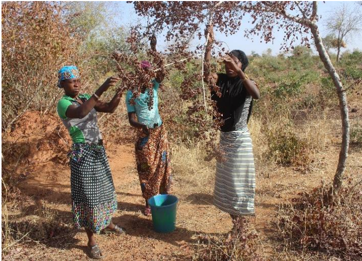
Recherche de graines

Cette section a poursuivi ses activités de production et d'entretien de plants d'espèces endogènes dont certains ont été vendus. Ces activités concernent la préparation du terreau, le repotage, les semis, l'arrosage quotidien, et le cernage.