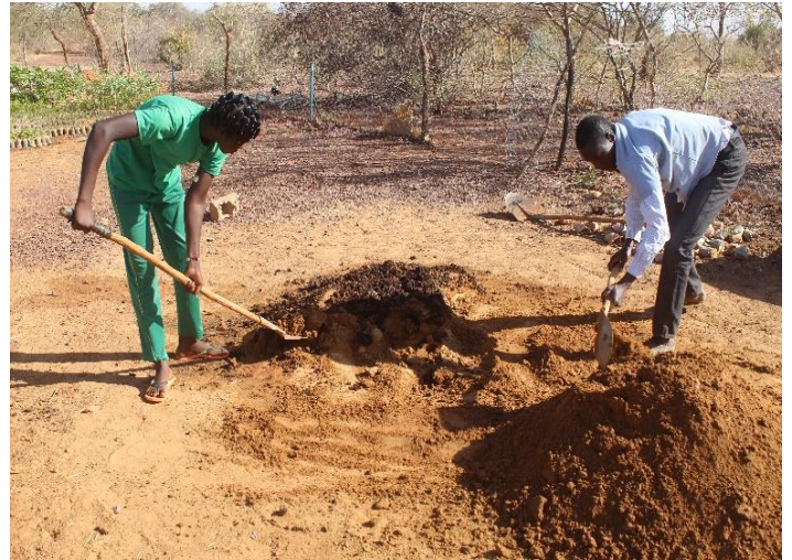
Préparation du terreau